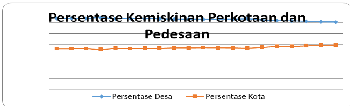
Gambar 2. Persentase Kemiskinan Penduduk Perkotaan dan Pedesaan