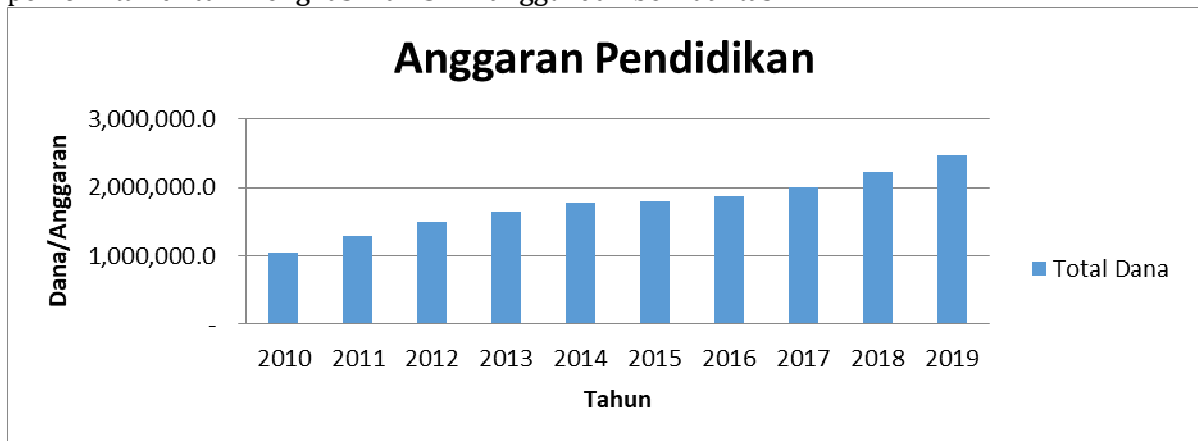
Grafik 1. Anggaran Pendidikan

yang memiliki SDM yang berdaya saing di tingkat internasional. Dana yang dikucurkan secara garis besar mengalami peningkatan dalam pengalokasian, sehingga terlihat keseriusan dari pemerintah untuk menghasilkan SDM unggul dan berkualitas.