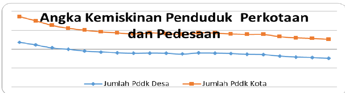
Gambar 1. Angka Kemiskinan Penduduk Perkotaan dan Pedesaan

Dari grafik dapat kita katakan alokasi dana untuk bidang pendidikan mengalami peningkatan dalam 10 tahun terakhir. Kenaikan dan anggaran pendidikan ini tidak terlepas dari keinginan pemerintah untuk terus meningkatkan kualitas SDM agar nantinya dapat keluar dari kemiskinan. Sekitar 14% masyarakat Indonesia dari kurang lebih 240 juta jiwa masih dikategorikan sebagai rakyat miskin dengan menggunakan indicator berpendapatan 1$ perhari atau sekitar 30 juta rakyat masih miskin. Jika mengacu kepada indicator bank dunia yang mendefinisikan rakyat miskin adalah orang memiliki pendapatan kurang dari 2$ perhari maka jumlah rakyat miskin di Indonesia sekitar 35%.n melambat, baik di kota maupun di desa. Namun jika melihat kepada definisi kemiskinan yang multidimensi, maka sulit untuk menyimpulkan apakah kemiskinan di Indonesia benar mengalami penurunan atau tidak.