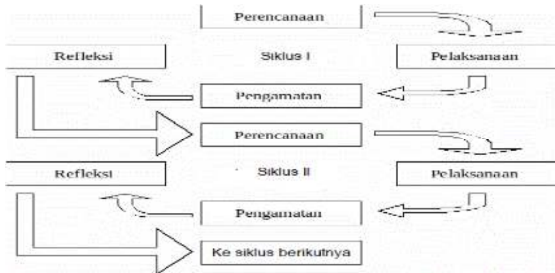
Gambar 1. Desain Penelitian

Subjek penelitian adalah siswa kelas V semester I, mata pelajaran PKn untuk materi Negara Kesatuan Republik Indonesia. Jumlah siswa kelas V ada 22 siswa terdiri dari 8 laki – laki dan 14 perempuan. Adapun model siklus menurut Suharsimi Arikunto (2009:16) dapat digambarkan dengan skema sebagai berikut: